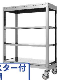
キャスター付 固定棚